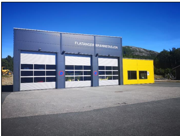
Ny brannstasjon på Lauvsnes stod ferdig i 2019.

Flatanger har fra 1. januar 2020 hatt et administrativt vertskommunesamarbeid med Namsos kommune om brannvern og feiertjenester. Ved siden av Flatanger brannstasjon er det etablert branndepot i grendene Hasvåg, Jøssund og Utvorda. Ifølge teknisk sjef ivaretar kommunen sitt overordnede ansvar gjennom årlige møter med Namsos kommune, og han forteller at tjenesten er oppdatert i tråd med nye forskrifter. Den nye brann- og redningsvesenforskriften trådte i kraft fra 1. mars 2022.