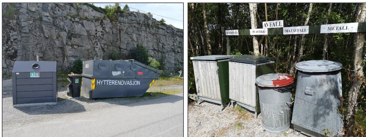
Returpunkt ved et hytteområde og avfallsløsning ved et utfartssted

På MNA sin hjemmeside er det lagt ut fylldig informasjon om ordningen for hytterrenovasjon.