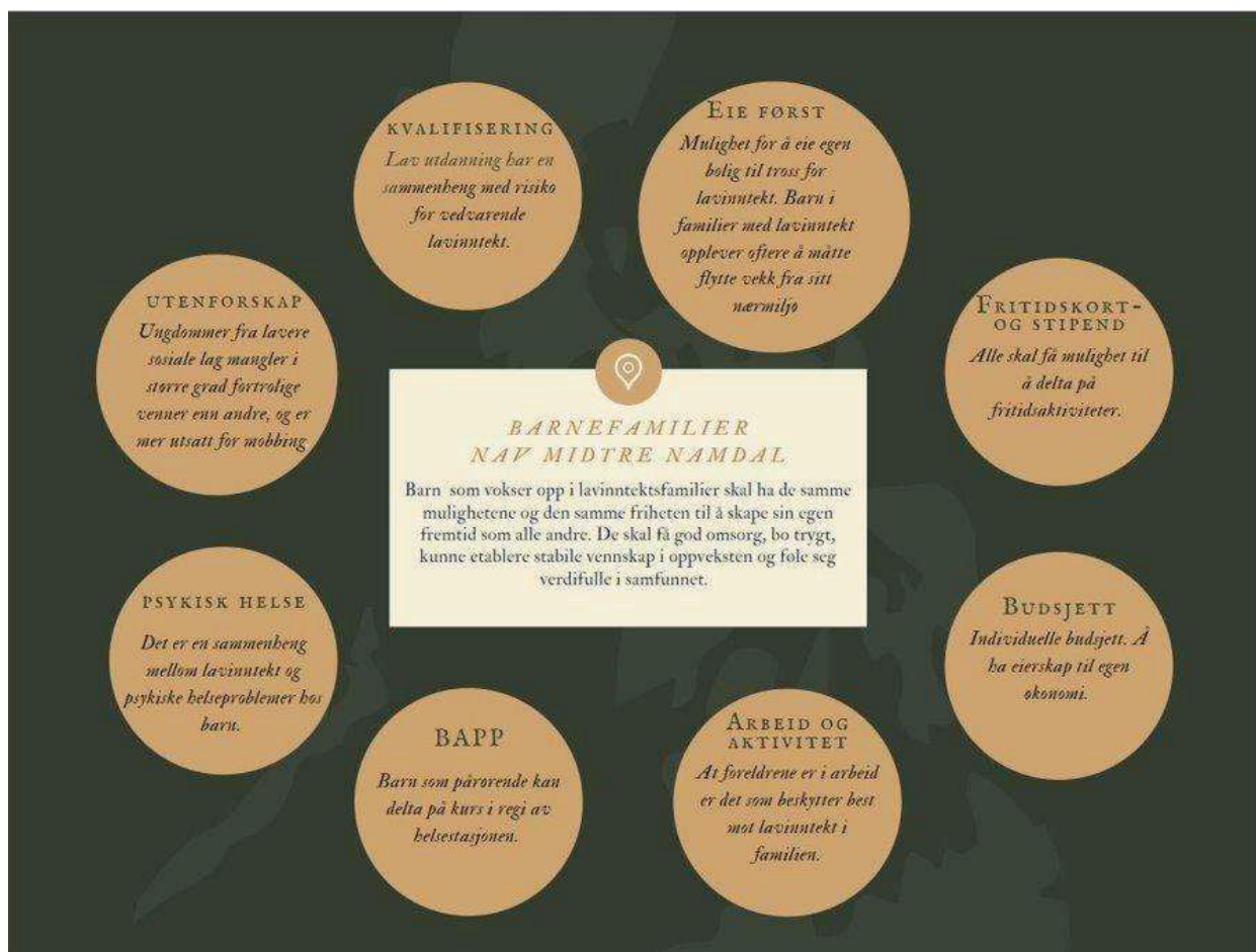
Figur 3. NAVs tankekart