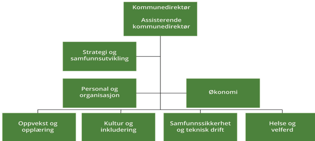
Figur 1. Organisasjonskart i Namsos kommune

Arbeidet med barnefattigdom går på tvers av alle sektorer i kommunen. Arbeidet som går mest direkte på å motvirke fattigdom, skjer i enhetene oppvekst og opplæring, og kultur og inkludering. Under vises kommunens organisasjonskart som viser hvordan enhetene er organisert.