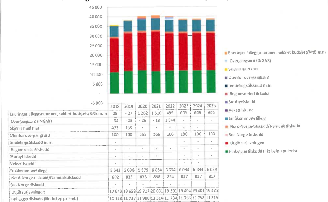
Utvikling av rammetilskudd uten inntektsutjevning 2018 - 2025

Dette anslaget kan man kontrollere opp mot regnskap 2021 og budsjett 2022. Det samsvar bra mellom disse. Man kan med noen grad av sikkerhet legge til grunn prognoser for de nærmeste årene basert på det innbyggertallet som er lagt til grunn.