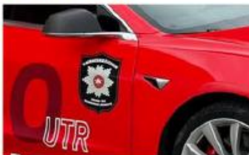
Emblem til VRBRT – bilde tatt utenfor Bodø Brannstasjon – se FB siden

https://www.facebook.com/search/top?q=k160utr