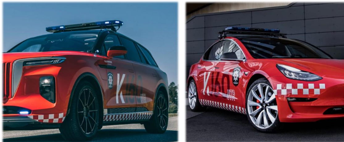
Figur 3. Bilder av opplæringsbiler disponert av K160UTR

slik skriftlig godkjenning, men kjøretøyene er registrert som godkjente utrykningskjøretøy i regi av VRBRT. På grunn av stor likhet til VRBRT sine tjenestebiler (farge, logo), mener revisor at det er en fare for at publikum/innbyggere forveksler disse opplæringsbilene med VRBRT sine tjenestebiler. Revisor gjør også oppmerksom på at uhjemlet bruk av «et norsk eller utenlandsk offentlig våpen, merke eller segl eller noe som lett kan forveksles med slike» er et brudd på straffeloven §165 b) (Justis- og beredskapsdepartementet 2005).