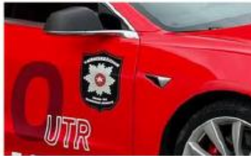
Emblem til VRBRT – bilde tatt utenfor Bodø Brannstasjon – se FB siden

https://www.facebook.com/search/top?q=k160utr