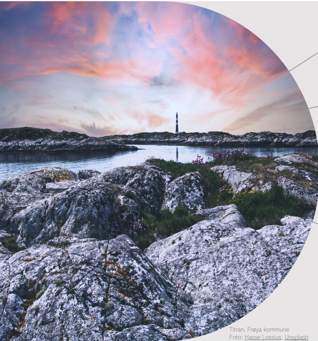
Titran, Frøya kommune