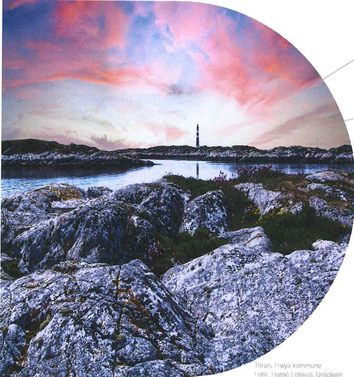
Titran, Frøya kommune