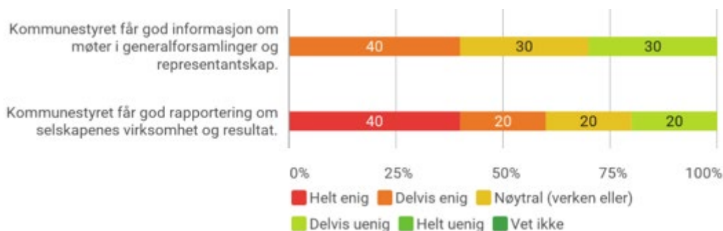
Figur 2. Formannskapets oppfatning av informasjonsflyt til kommunestyret

I figuren ser vi at 40 prosent mener at kommunestyret får god informasjon og god rapportering. Henholdsvis 30 prosent og 20 prosent er delvis uenige i at kommunestyret får god informasjon og god rapportering. Det er ingen som er helt uenige i påstanden.