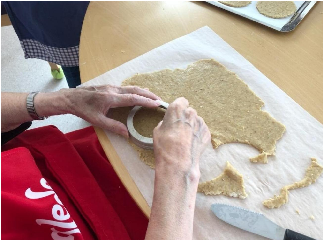
Lierne kommune er sertifisert som livsgledehem, og her er det baking som foregår

Compilo benyttes som kommunens avvik- og internkontrollsystem. Det er fortsatt et mål å forbedre innhold og bruk av dette systemet, og få alle ansatte opp på samme kunnskapsnivå på dette systemet.