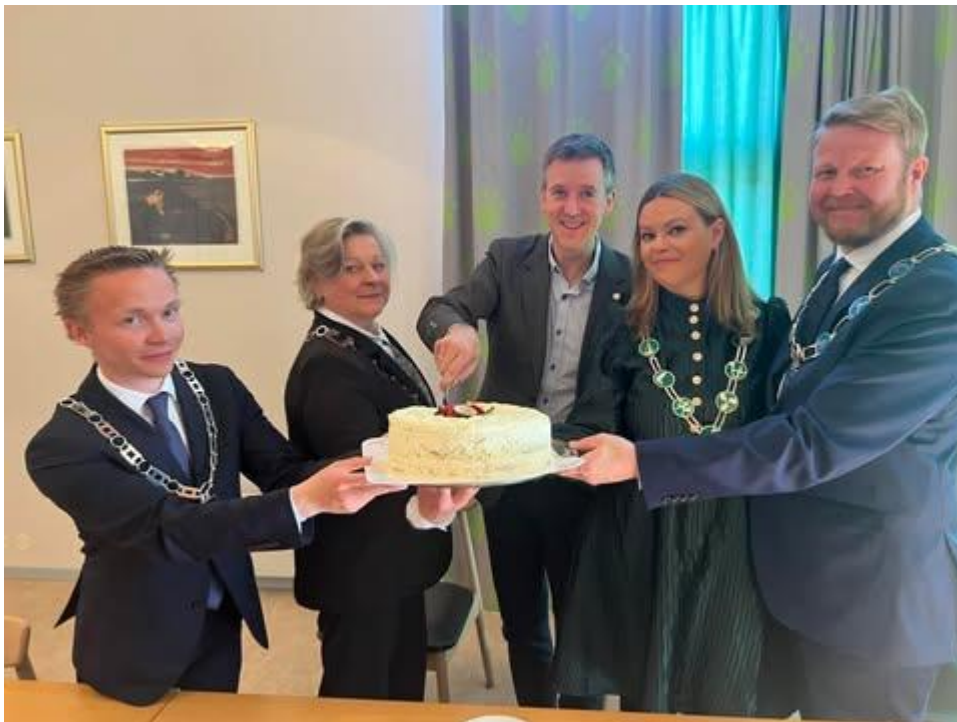
Sigining av bygdevekstavtale – ordførerne i Indre Namdal sammen med kommunal- og distriktsminister Erling Sande