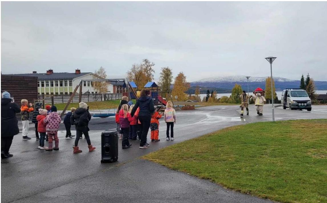
Bjørnis på besøk på Stortangen skole

Konstituert kommunalsjef oppvekst og velferd